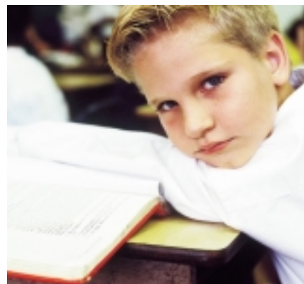
Le plan d'action du nouveau ministre de l'Éducation nationale a pour ambition de réduire de 5 % en trois ans le nombre d'élèves qui entrent au collège sans posséder les bases du français.

Le prix du livre reste encore un obstacle pour les jeunes.