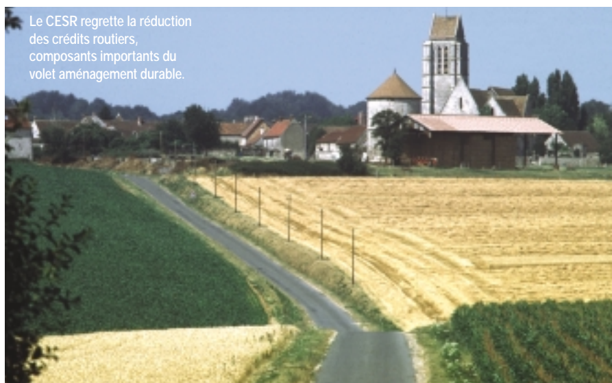
Le CESR regrette la réduction des crédits routiers, composants importants du volet aménagement durable.

En matière d'enseignement, le CESR donne