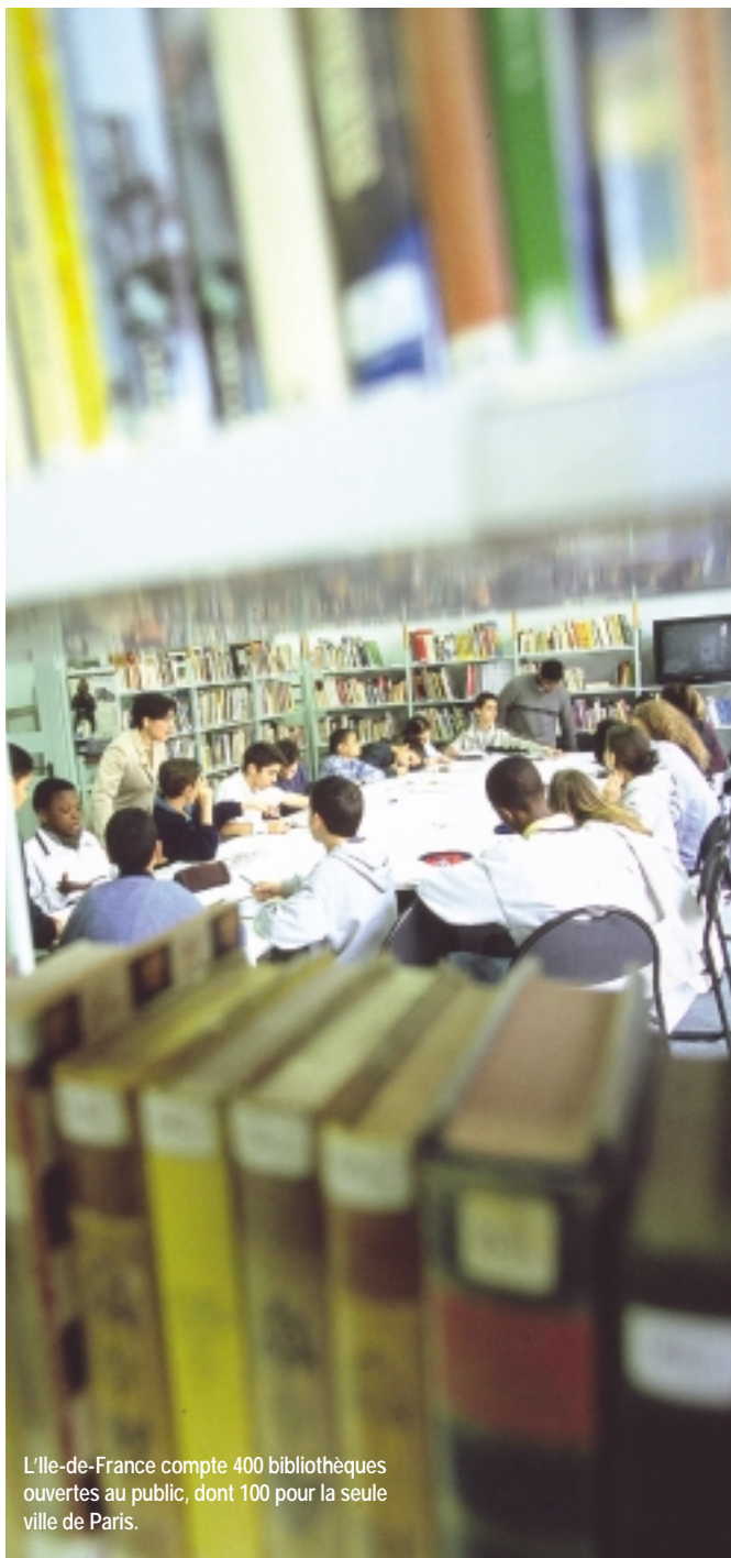
L'Ile-de-France compte 400 bibliothèques ouvertes au public, dont 100 pour la seule ville de Paris.