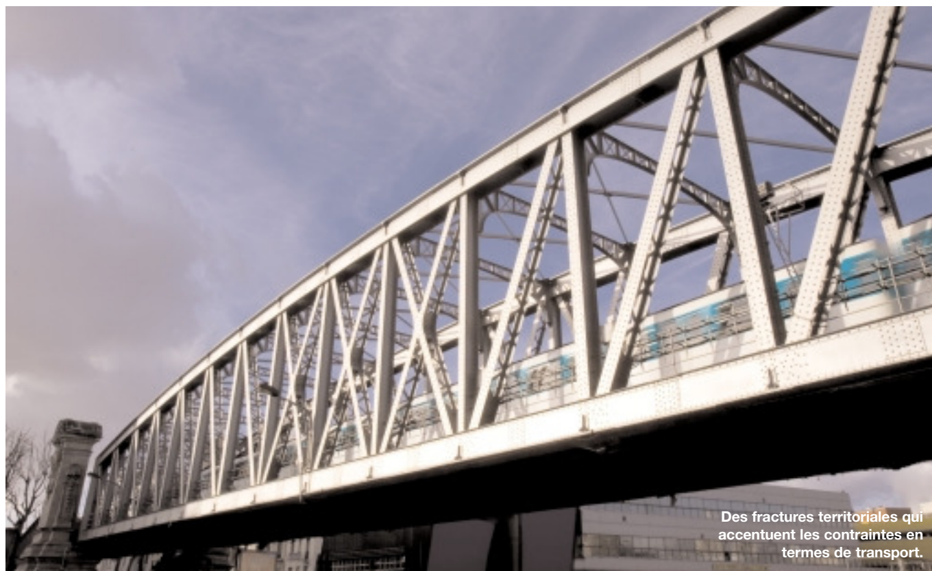
Des fractures territoriales qui accentuent les contraintes en termes de transport.