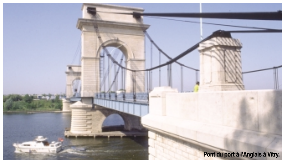
Pont du port à l'Anglais à Vitry.

tion de l'activité de l'aéroport d'Orly ont entraîné une lourde perte d'emplois (- 6 490 entre 1990 et 1998). Le territoire doit également résoudre ses problèmes de transport et de logement. Enfin, reste la problématique environnementale causée par l'existence de coupures urbaines, de friches industrielles, d'installations classées SEVESO et de nuisances sonores. La gestion des crues, la revalorisation du paysage urbain et des berges des deux fleuves restent des objectifs.