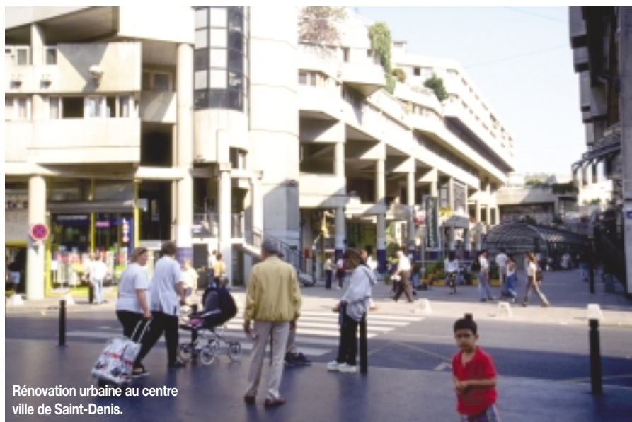
Rénovation urbaine au centre ville de Saint-Denis.

D'autre part, dans le cadre d'une approche mettant en perspective les questions d'urbanisation, d'habitat, de mixité sociale, de maîtrise des espaces..., le CESR préconise une meilleure prise en compte du concept de développement durable. C'est de fait l'ensemble du cadre de vie des Franciliens qui est en jeu et il est nécessaire de concilier développement économique, développement social et environnement. En particulier, la