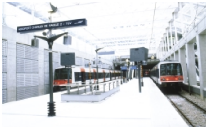
Gare RER TGV Roissy Charles-de-Gaulle.