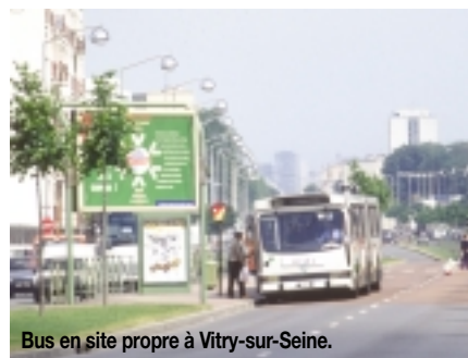
Bus en site propre à Vitry-sur-Seine.

Bièvre, secteurs dont les acteurs du territoire attendent des retombées économiques. Il possède de très importantes ressources foncières, dont il peut tirer un grand parti. En outre, le territoire bénéficie d'un véritable dialogue entre les partenaires (État, Région, département...) auquel s'ajoutent les activités de l'association Seine-Amont développement et de la mission d'État spécifique "Seine-Amont". Néanmoins, la forte désindustrialisation et la diminu-