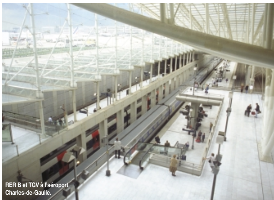
RER B et TGV à l'aéroport Charles-de-Gaulle.

question du foncier, très variable selon les zones, est cruciale et nécessite la mise en œuvre d'une politique garante d'une évolution équilibrée de la région.