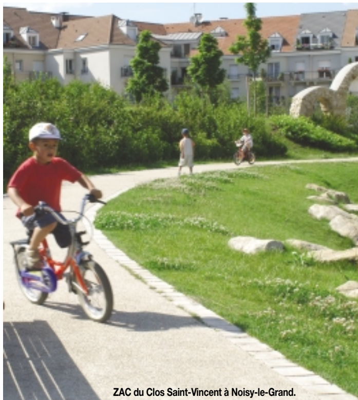
ZAC du Clos Saint-Vincent à Noisy-le-Grand.