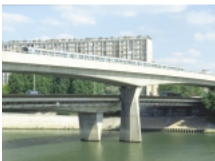
Passage d'un métro sur le pont de Clichy à Asnières.