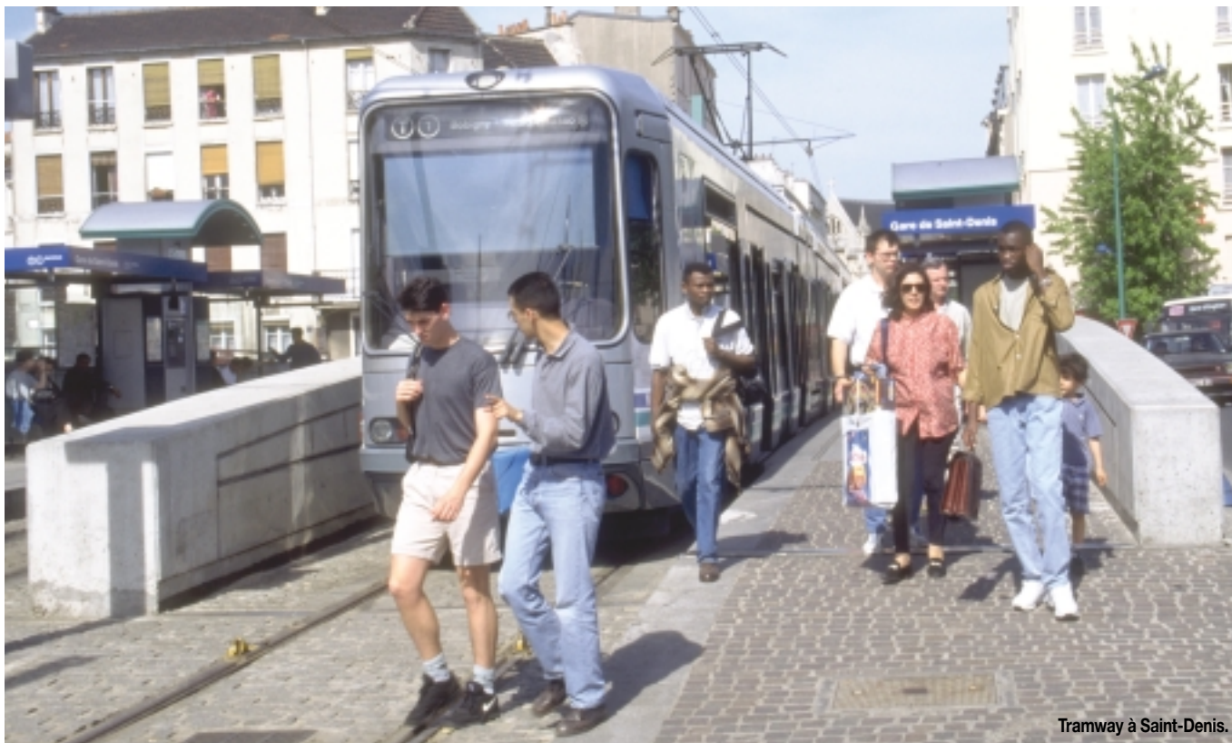
Tramway à Saint-Denis.