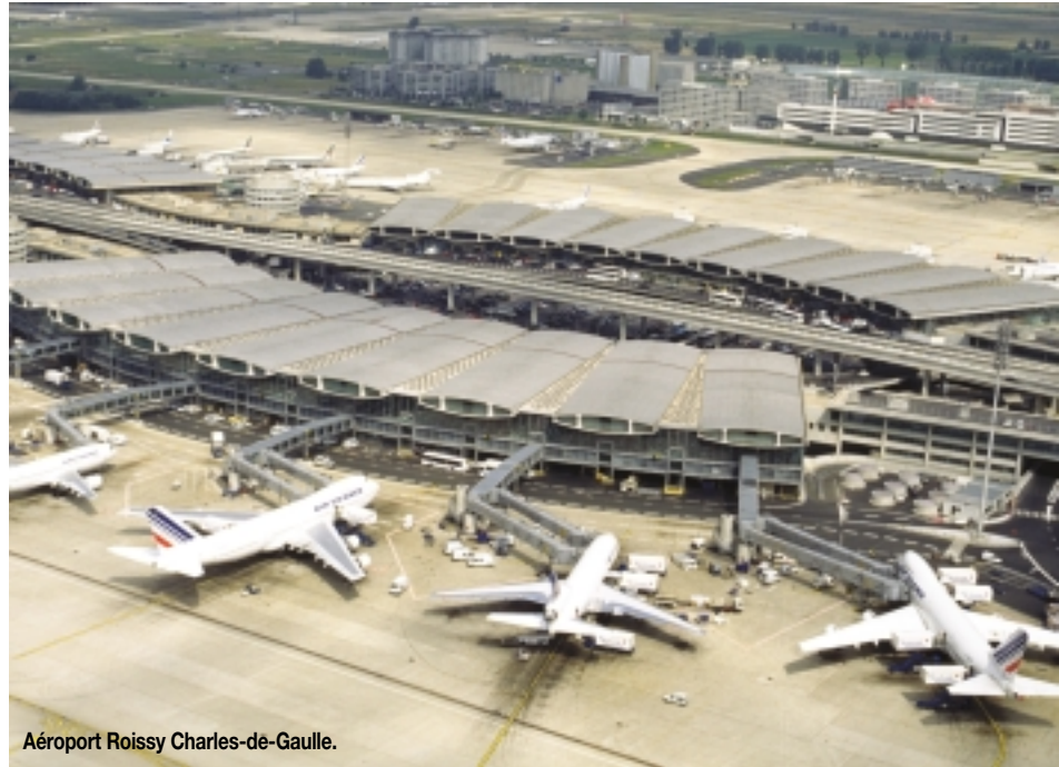
Aéroport Roissy Charles-de-Gaulle.