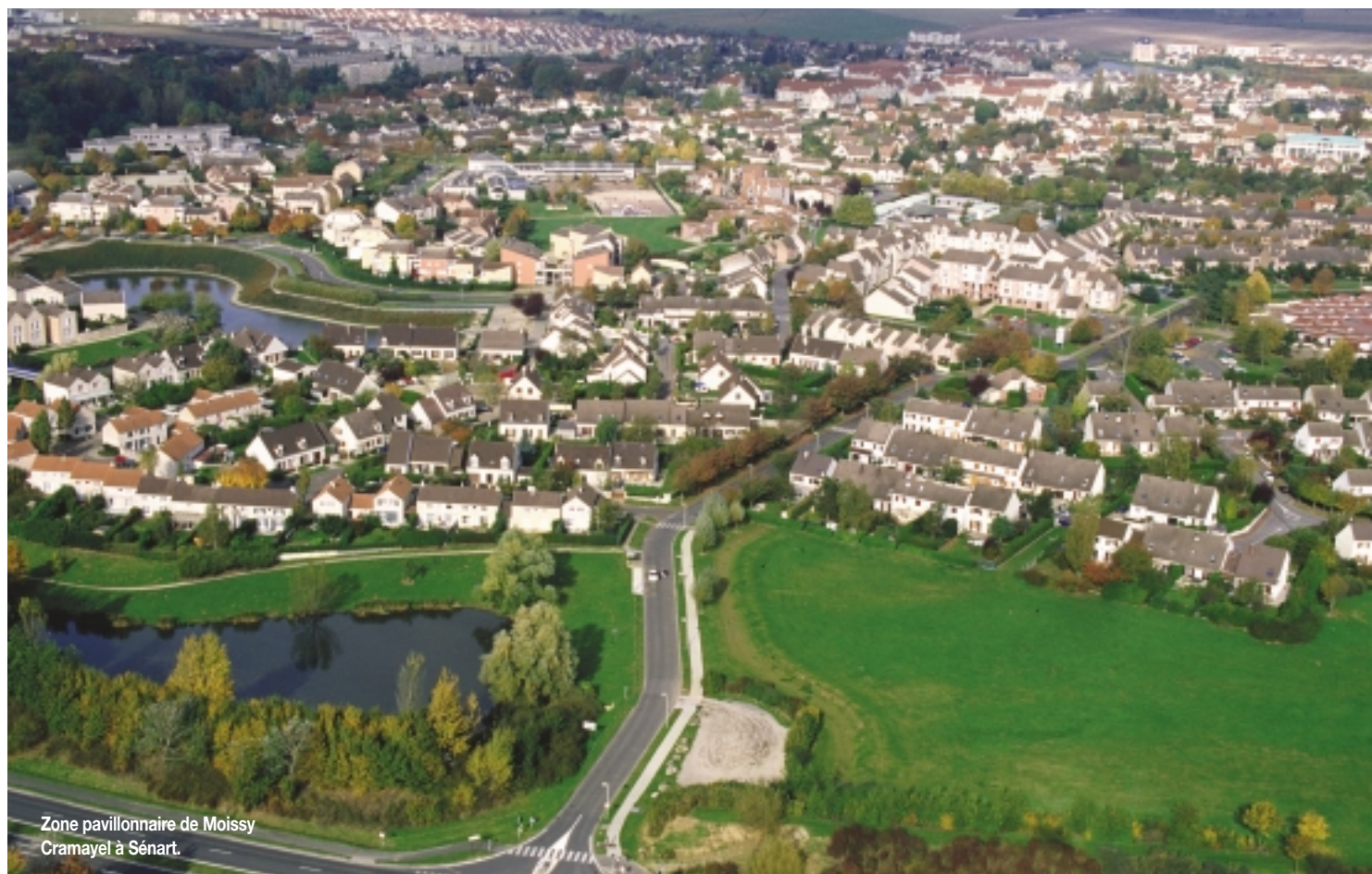
Zone pavillonnaire de Moissy Cramayel à Sénart.

Le CESR a procédé à l'analyse des dix territoires prioritaires prévus par le Contrat de plan État-Région, en vue d'un bilan à mi-parcours. Au-delà des problématiques particulières à chacun, il souligne et réitère les priorités communes en matière d'infrastructures, de formation, d'environnement et de qualité de vie.