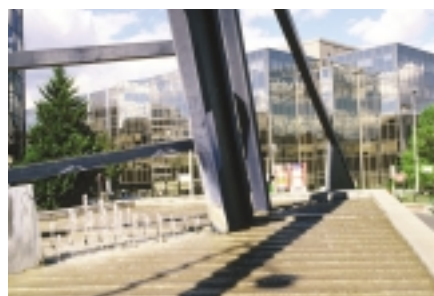
Immeubles de bureaux à Issy-les-Moulineaux (gauche) et à Boulogne (droite).