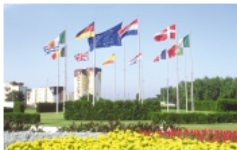
Ci-dessus : Hôtel de Ville de Moissy Cramayel Sénart. Ci-contre : Place de l'Europe à Melun.