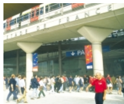
Gare RER La Plaine Saint-Denis Stade de France.

Plaine-de-France, organe partenarial (regroupant l'État, la Région, les départements, les communes et leurs établissements publics de coopération intercommunale) qui élabore le document stratégique de référence. Celui-ci établit les politiques de renouvellement urbain, d'extension du musée de l'Air et de l'Espace, réfléchit au développement des plateformes aéroportuaires de Roissy et du Bourget ou aux contraintes du plan d'exposition au bruit (PEB) en matière d'urbanisation. Malgré tout, les territoires de Plaine-de-France et de la Plaine Saint-Denis, très urbanisés, souffrent d'une pénurie du foncier facilement mobilisable et de graves problèmes sociaux. L'écart entre les besoins des entreprises, à la recherche de personnel très qualifié, et la population résidente, peu qualifiée, continue de s'accroître*. On constate également un déficit criant de services de proximité et de commerces, ainsi qu'une inadéquation des équipements éducatifs