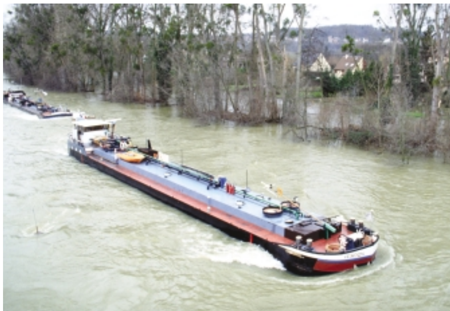
Ci-dessus : inondations aux Mureaux. Ci-contre : contre-allée et boulevard urbain aux Mureaux.

Territoire prioritaire touché par la désindustrialisation, Seine-Aval regroupe 23 communes aux franges de la région, dans le département des Yvelines (13,6 % de sa population, soit 184 183 habitants). En pleine mutation économique, il bénéficie de multiples éléments fédérateurs : la Seine, tout d'abord, mais aussi un patrimoine urbain et naturel de qualité, une forte tradition industrielle (aéronautique, automobile, mécanique, chimie et parachimie) et l'existence de filières d'activités (instruments de musique, éco-industrie, BTP, commerces). Si les réserves foncières sont nombreuses, la zone souffre de problèmes d'accessibilité routière, ferroviaire et de problèmes de franchissement de la Seine. La situation sociale y est très préoccupante, du fait d'un fort taux de chômage des actifs peu qualifiés et de la faiblesse du revenu des ménages. Sans compter l'absence d'identité à l'échelle du territoire et l'image dégradée dont il souffre, qui appellent une exigence de reconnaissance et de notoriété positive.